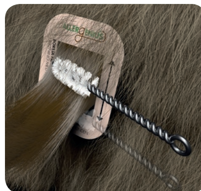
Borstning av långhårig päls