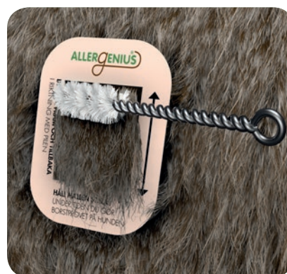
Borstning av korthårig päls